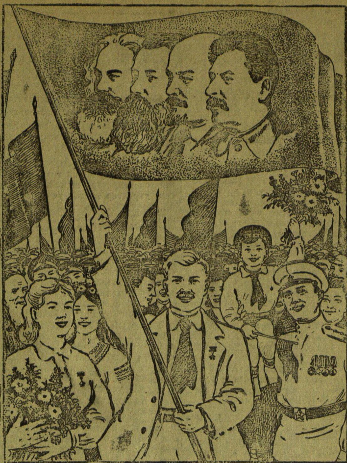
Рисунок А. Морозова.